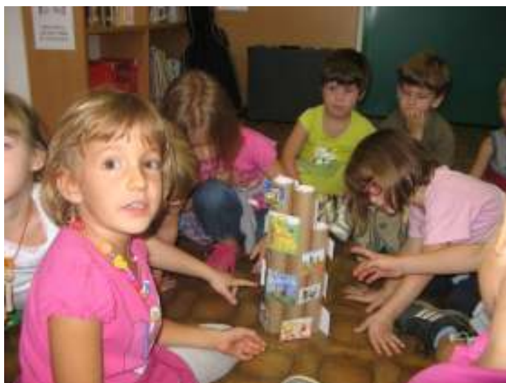
Mi pa poznamo knjižne junake!