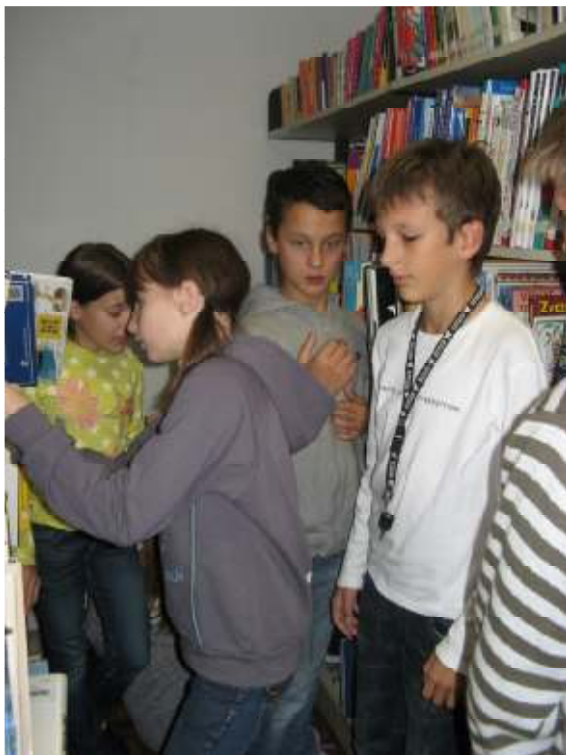
Učenci iščejo strokovne knjige na policah.

Po predstavitvi je vsaka skupina narekovala sošolcem pomembne podatke. Povedi so zapisali v zvezek.