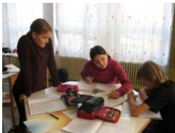
Izpisujejo si podatke, pripravljajo izvlečke.