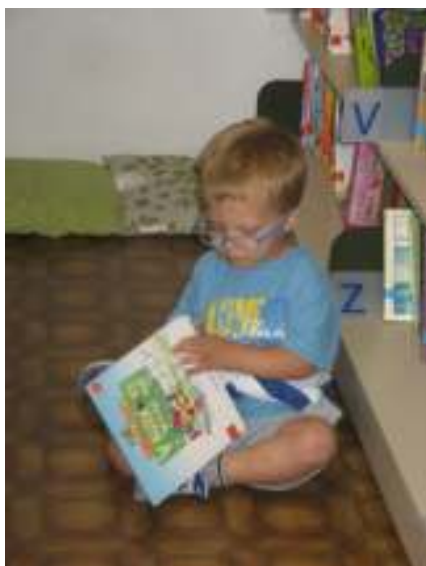
Le kaj se dogaja v kužkovi vasi?